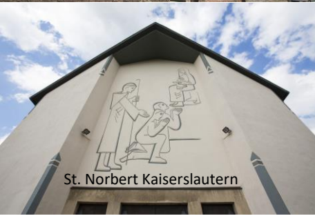
St. Norbert Kaiserslautern

ZUSAMMEN WACHSEN. WEITER DENKEN. Pfarrgremienwahl 16./17.11.2019