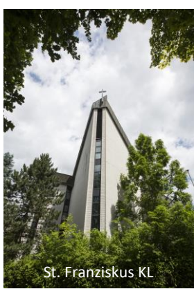
St. Franziskus KL