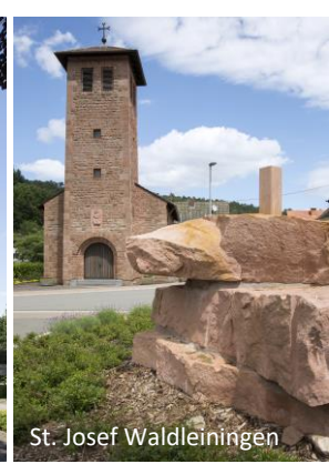
St. Josef Waldleiningen