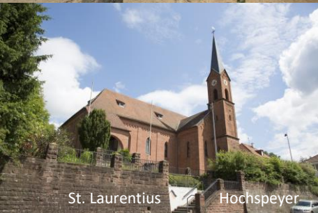
St. Laurentius Hochspeyer