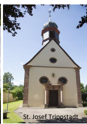
St. Josef Trippstadt