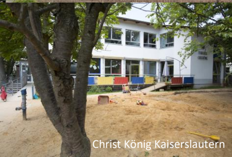
Christ König Kaiserslautern