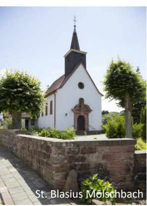
St. Blasius Mölschbach